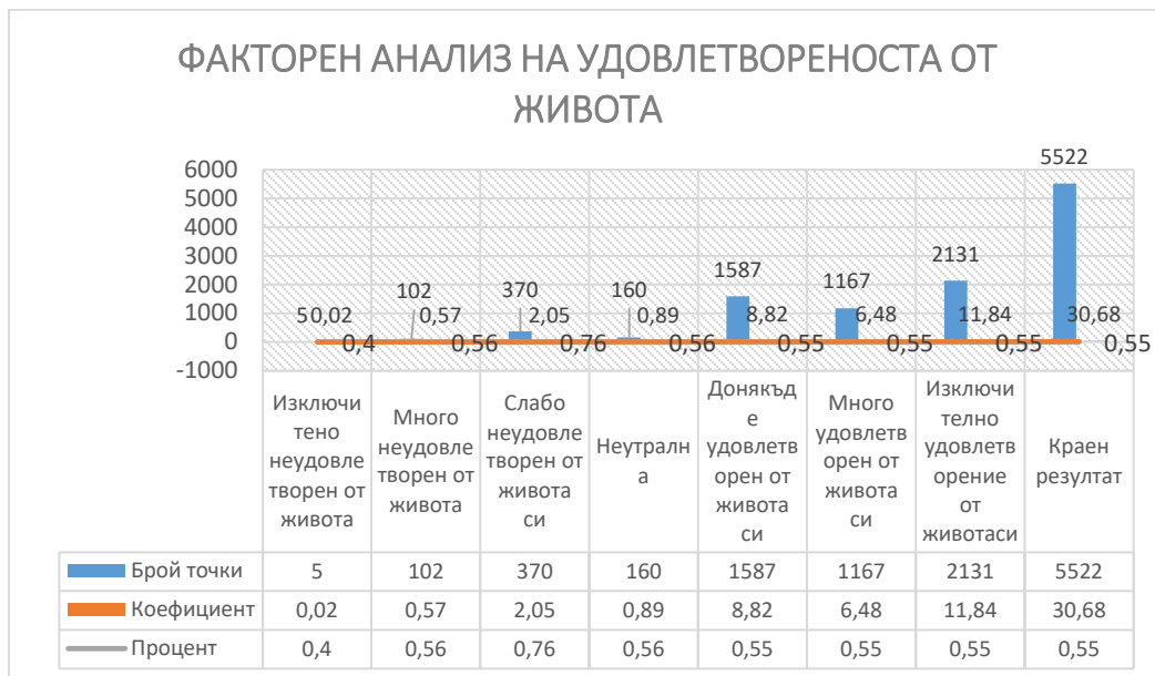
Диаграма 3. Краен резултат на конформаторния факторен анализ (метод на максималната вероятност) на компонентите за удовлетвореността от живота