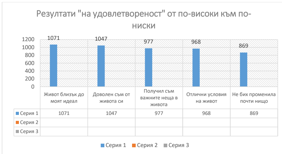
Диаграма 2. Подреждане на резултати „на удовлетвореността от живота“ от по-висок към по-нисък

От получените емпирични данни от „Скалата за Удовлетвореността от живота“ на Diner, Emmons, Larsen & Griffin (1885) се вижда, че с най-висок резултат е твърдението „Изключително удовлетворени от живота си“ – 2131 т. и с най-нисък е твърдението „Изключително неудовлетворен от живота“ – 5 т. Получените резултати показват, че учениците на възраст 11 – 14 години са „изключително удовлетворени от живота си“ (~38,36 %) и само една малка част от тях са „изключително неудовлетворени от живота“ (~0,09 %). Според децата „независимо, че са доволни – има все още какво да се желае от живота“. За тях е „много важно да бъдат обкръжени с добри хора, които да ги уважава и обичат“, но „за съжаление много често се сблъскват с лицемери и егоисти“. Те се „нуждаят от внимание и разбиране не само от своите приятели, но и от учителите и семейството“. Децата споделиха, че „живота е не само красив, но и много пъстър, защото е изпълнен е не само с добро, но и лошо“ и ако „можеха да променят нещо – биха направили света по-добро място за живеене, в което има мир и разбирателство, обич и благодарност“.